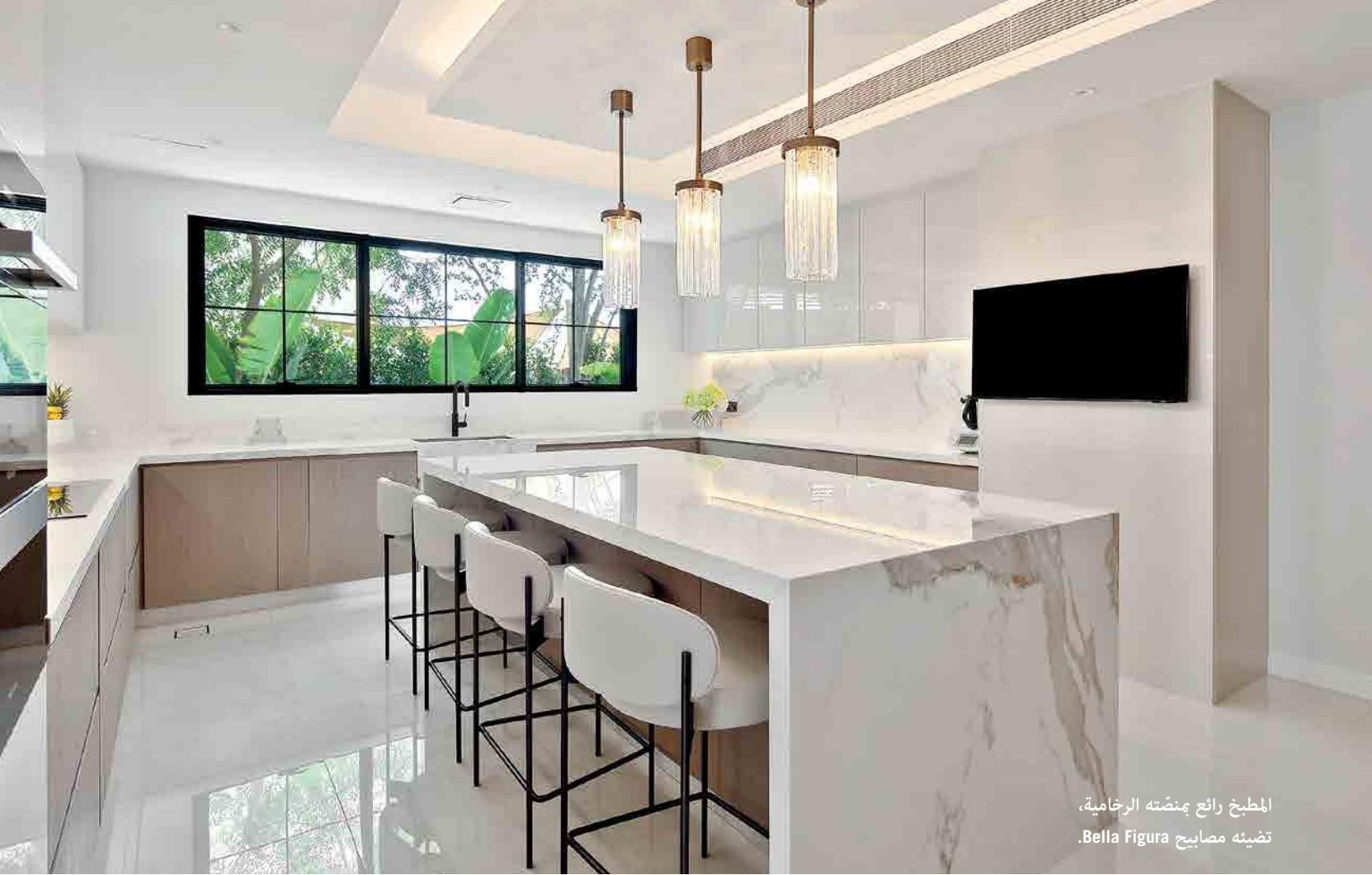
المطبخ رائع بمنصته الرخامية، تضيئه مصابيح Bella Figura.