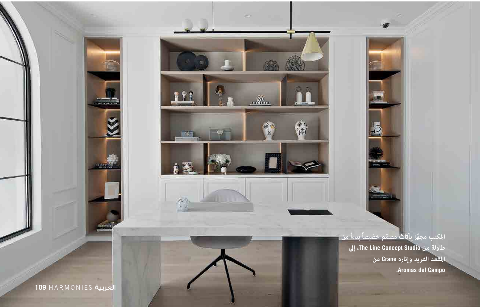
المكتب مجهز بأثاث مصمم خصيصاً بدءاً من طاولة من The Line Concept Studio، إلى المقعد الفريد وإثارة Crane من Aromas del Campo.