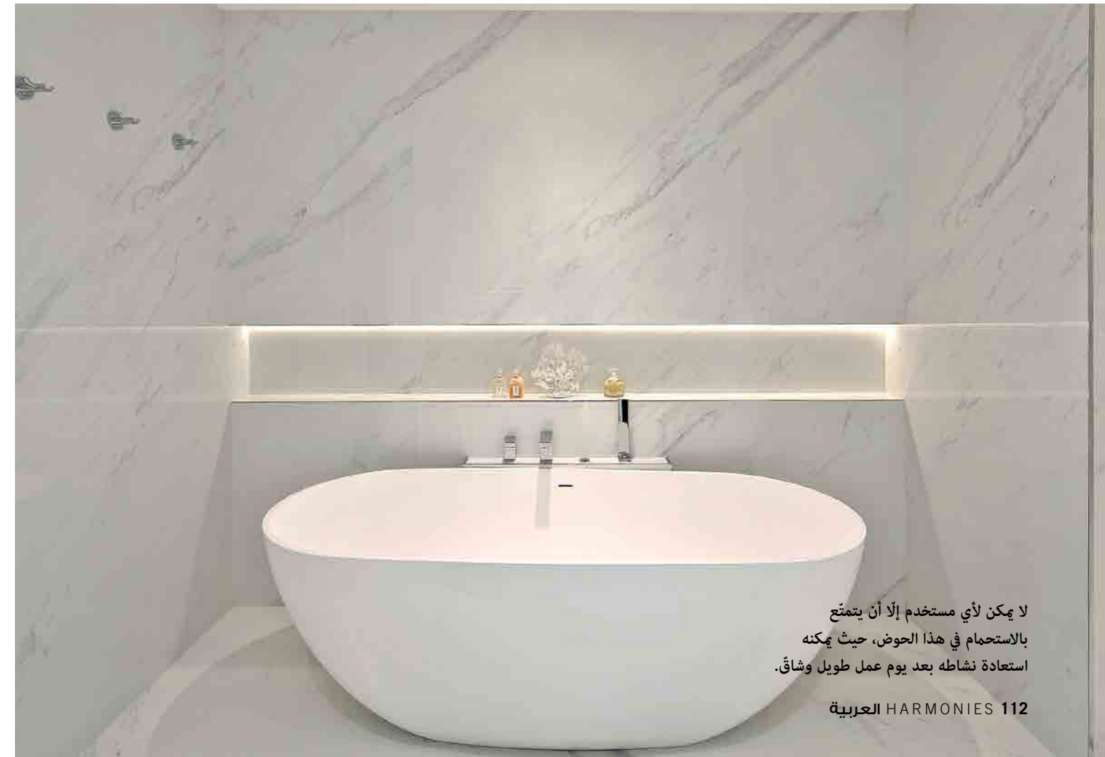
لا يمكن لأي مستخدم إلا أن يتمتع بالاستحمام في هذا الحوض، حيث يمكنه استعادة نشاطه بعد يوم عمل طويل وشاق.

الداخلي وهيكلها الخارجي وخلق أجواء متناغمة. وفي حين تضيف المعادن البرونزية المعتقة المصقولة على التصميم لمسة من الجمالية والراقي، تزيد النوافذ والأبواب المقوّسة المصنوعة من الفولاذ الأسود الرفيع من جاذبيته وسحره وتقوم بدورٍ هندسي رئيسي، بحيث إنها كاملة بمفصلات مخفية، وزجاج مزدوج الأداء، ومكسورة حرارياً للعزل وكفاءة الطاقة. كل ركن من أركان هذا المسكن هو متعة بصرية في سيمفونية من التباينات والهندسة المعاصرة والعابرة للعصور والأزمان، تجمع بتناغم وسلاسة بين الجماليات الحديثة والعناصر المعمارية الكلاسيكية. لم ينس المهندسون العمل بدقة على الأرضيات. فقد استخدموا لتغطيتها بلاطاً كبيراً من البورسلين يكمله ترصيع Pietra Gray. تم اختيار هذه المادة لحجمها من جهة ومن جهة أخرى لتشابهها مع الرخام. أما في غرفة النوم، فكان الاختيار للأرضيات الخشبية Khars الجذابة والمتينة. رخام طبيعي، أثاث منتقى بإتقان، قشرة ملونة في النجارة، لمسات برونزية... كلها عناصر تعزز البصمة الفخمة والجوّ الدافئ. ■