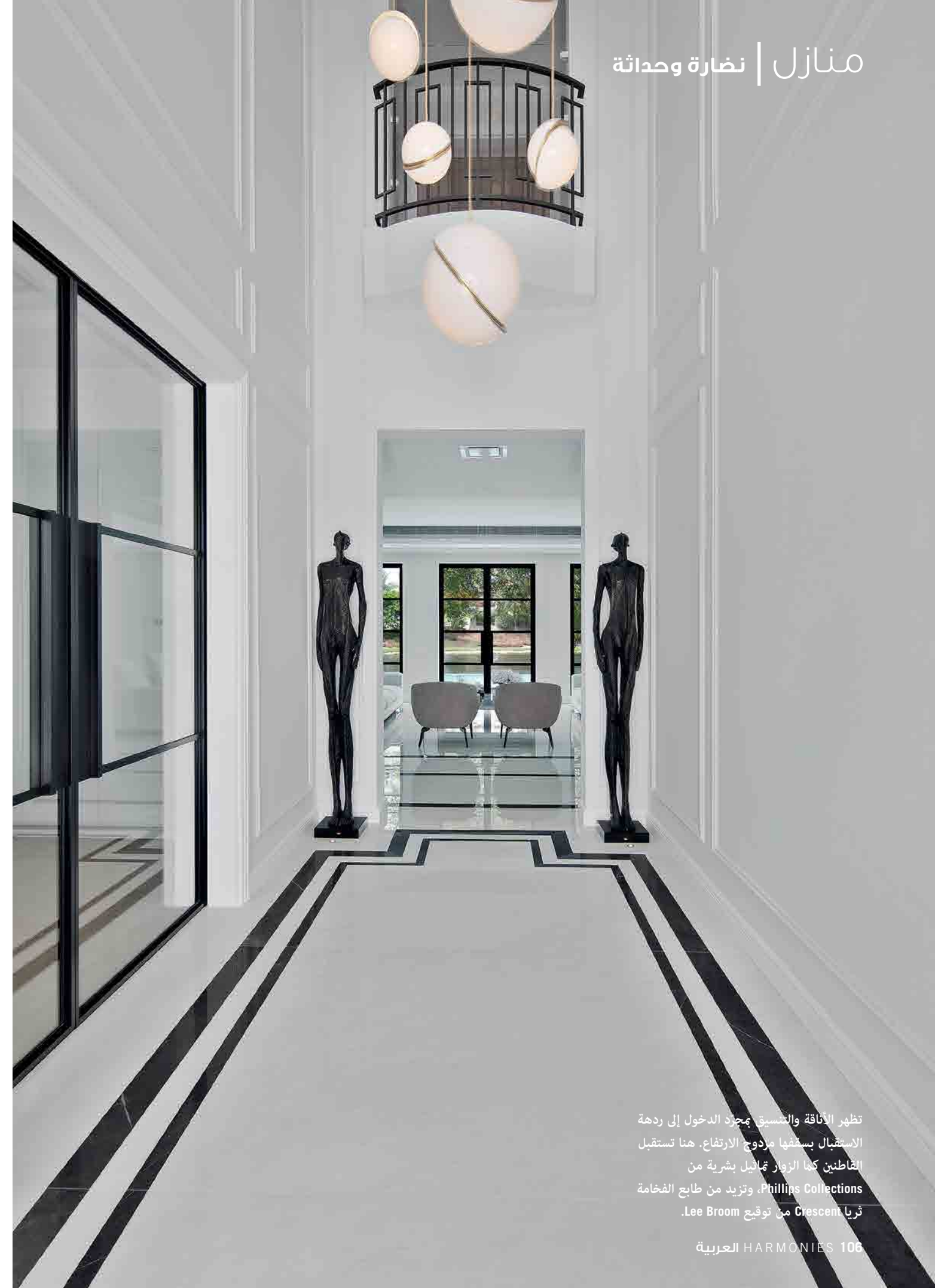
تظهر الأناقة والتسويق بمجرد الدخول إلى ردهة الاستقبال بسقفها مردوح الارتفاع. هنا تستقبل الفاطنين كما الزوار تماثيل بشرية من Phillips Collections، وتزيد من طابع الفخامة ثريا Crescent من توقيع Lee Broom.