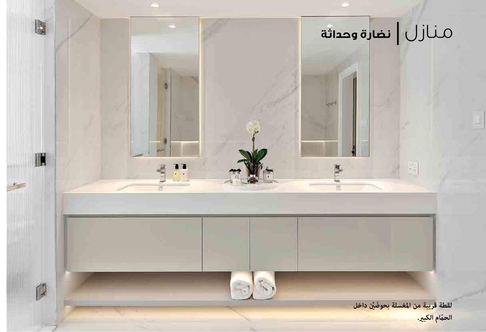
لقطة قريبة من المغسلة بحوضين داخل الحمام الكبير.