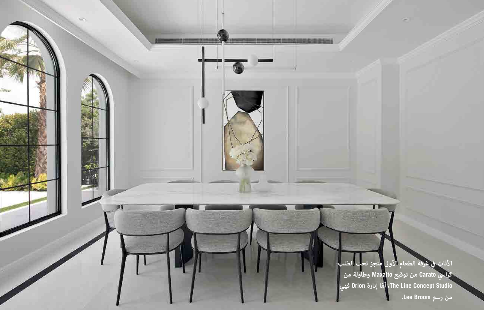
الأثاث في غرفة الطعام الأولي منجز تحت الطلب: كراسي Carato من توقيع Maxalto وطاولة من The Line Concept Studio، أما إنارة Orion فهي من رسم Lee Broom.