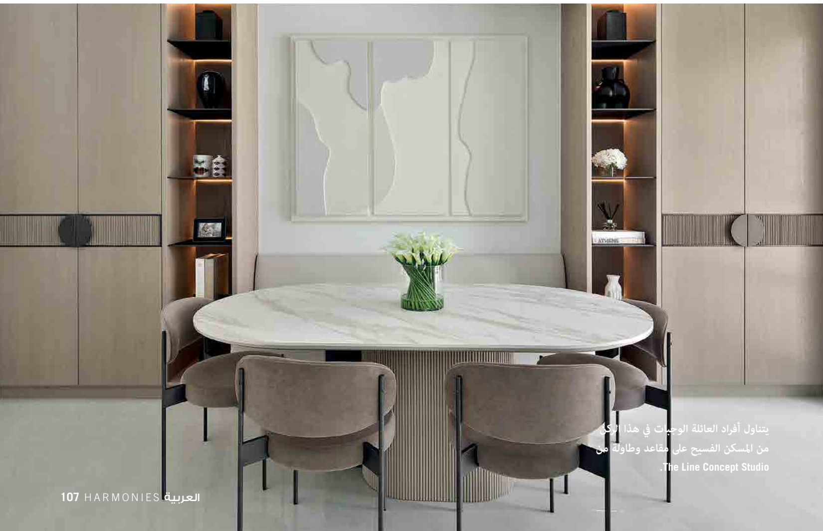
يتناول أفراد العائلة الوجبات في هذا المكان من المسكن الفسيح على مقاعد وطاولة من The Line Concept Studio.