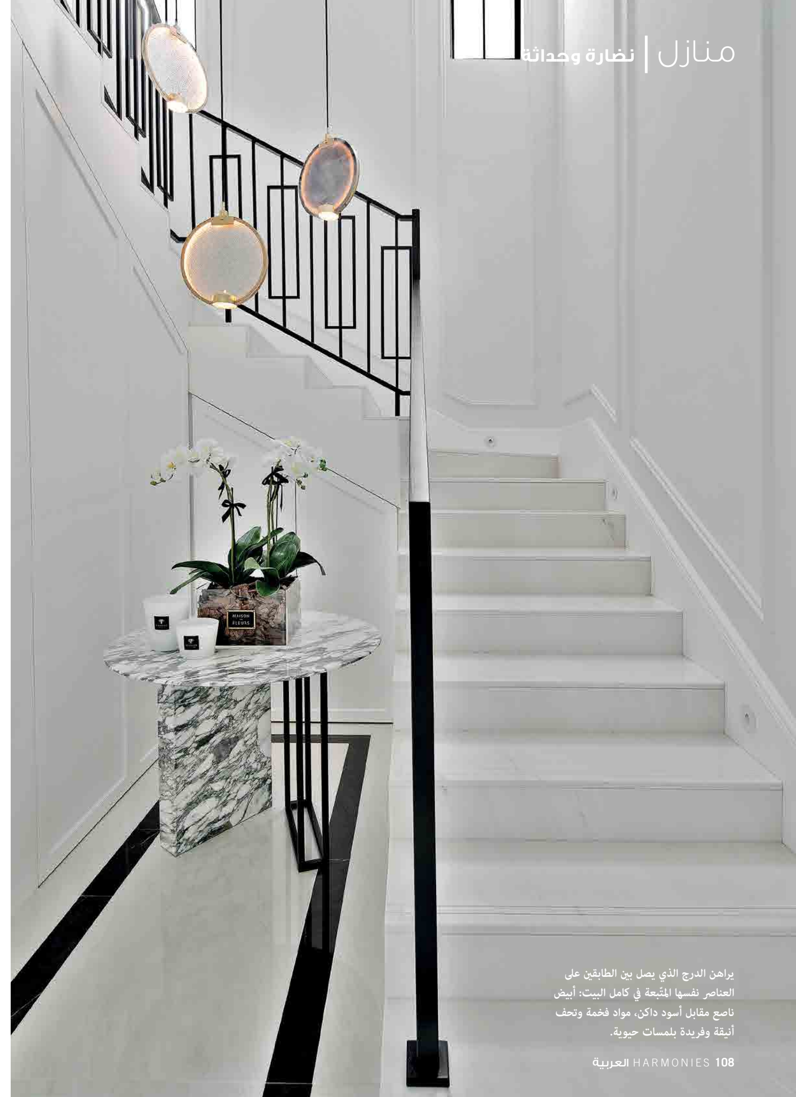
يراهن الدرج الذي يصل بين الطابقين على العناصر نفسها المتبعة في كامل البيت: أبيض ناصع مقابل أسود داكن، مواد فخمة وتحف أنيقة وفريدة بلمسات حيوية.